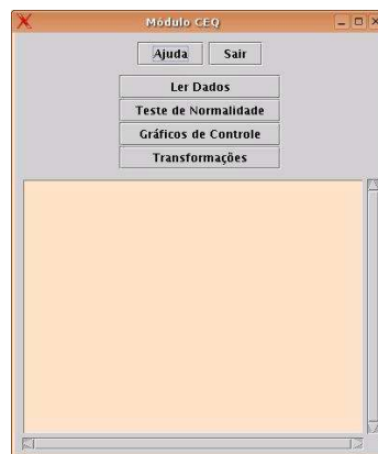
FIGURA 2 TELA INICIAL DO MÓDULO MODCEQ.

Em sua primeira versão, o ModCEQ é um novo módulo de apoio ao ensino de conceitos básico de Controle Estatístico de Qualidade. Ele é responsável por implementar cinco gráficos de controle estatístico de qualidade, testes de normalidade e transformações em conjuntos de dados. A Figura 2 apresenta a tela inicial do módulo ModCEQ .