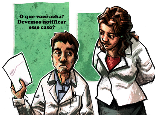
Fig. 4. Uso dos diálogos nas cenas do jogo.

Essa intervenção, nos casos de violência contra a mulher nos serviços de saúde, constitui-se um grande desafio para os profissionais da área que entendem como um problema que extrapola as suas capacidades técnicas e a sua intervenção. Diante dessa concepção, muitos deles apresentam sérias dificuldades para identificar mulheres em situação de risco ou vulnerabilidade à violência. Muitos desses profissionais alegam “falta de tempo e de recurso, medo de ofender as mulheres, falta de treinamento, medo de abrir a ‘Caixa de Pandora’ e frustração por perceber a não resposta de muitas usuárias aos conselhos que recebem”, pág. 696 [17].