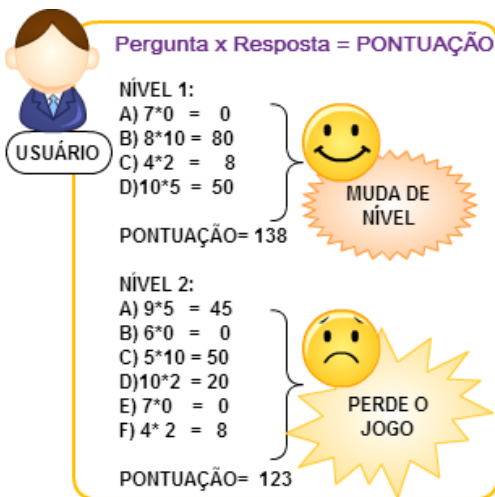
Fig. 5. Exemplo de funcionamento do modelo de avaliação com base na soma dos pontos ponderados e categorização do jogador.

Essa avaliação se mostrou mais interessante, pois permitiu ao fim de cada nível categorizar o jogador de forma mais específica, em quem ele, perdendo ou ganhando, saberá o nível do seu desempenho, o que vai além da mera pontuação e aumenta o feedback e a interação entre jogo-usuário, bem como fortalece o caráter pedagógico do jogo de avaliar aspectos afetivos e com isso motivar mudanças de concepções, a partir de uma perspectiva construtivista.