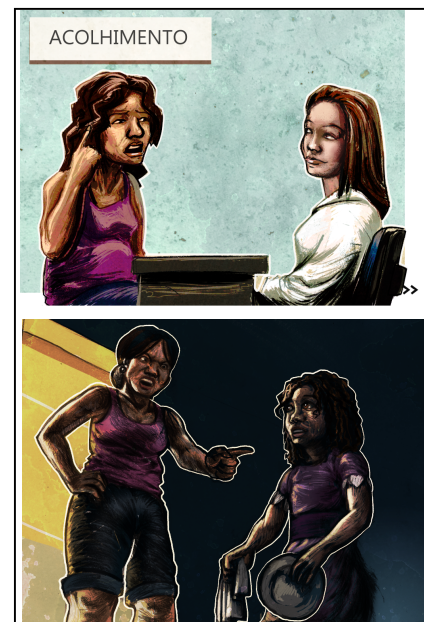
Fig. 3. Exemplo de variação da intensidade de cor das imagens com a mudança de níveis. No alto, uma cena do primeiro nível e, abaixo, do segundo nível.